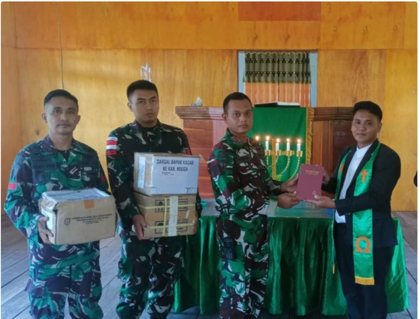
Foto: Satgas Yonif 503/Mayangkara kembali menunjukkan dedikasinya kepada masyarakat di Papua dengan memberikan dukungan alat musik untuk kegiatan ibadah di Gereja GKI Bethesda Batas Batu, Distrik Krepkuri, Kabupaten Nduga. Pada Minggu, 12 Januari 2025.

NDUGA- Satgas Yonif 503/Mayangkara kembali menunjukkan dedikasinya